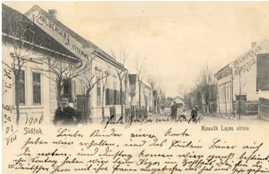
A Kossuth utca 1906-ban. Mentén több zsidó család üzlete is működött