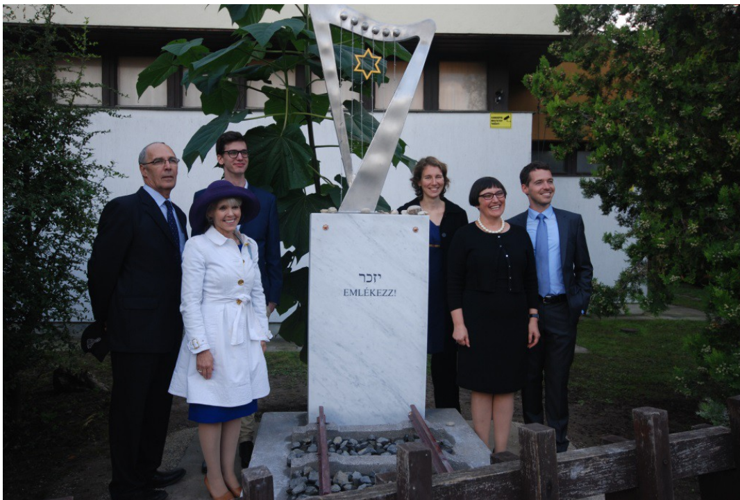
A holokauszt emlékmű avatása 2014-ben