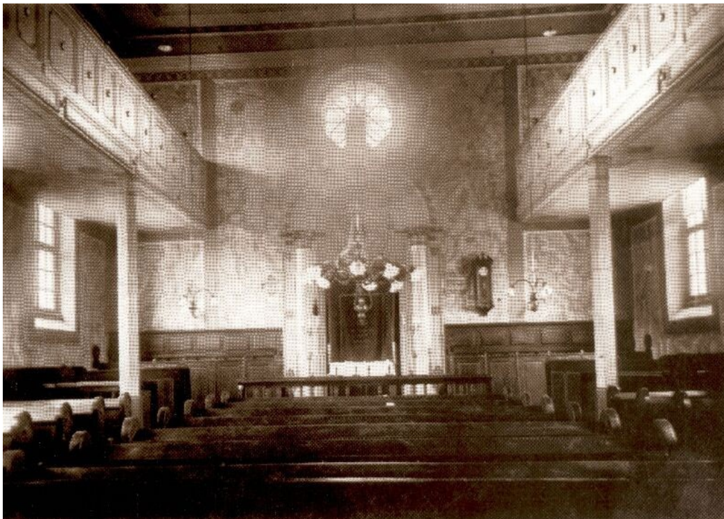
A régi zsinagóga belseje