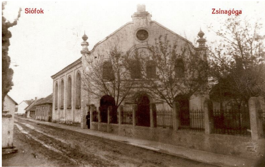
A régi zsinagóga épülete