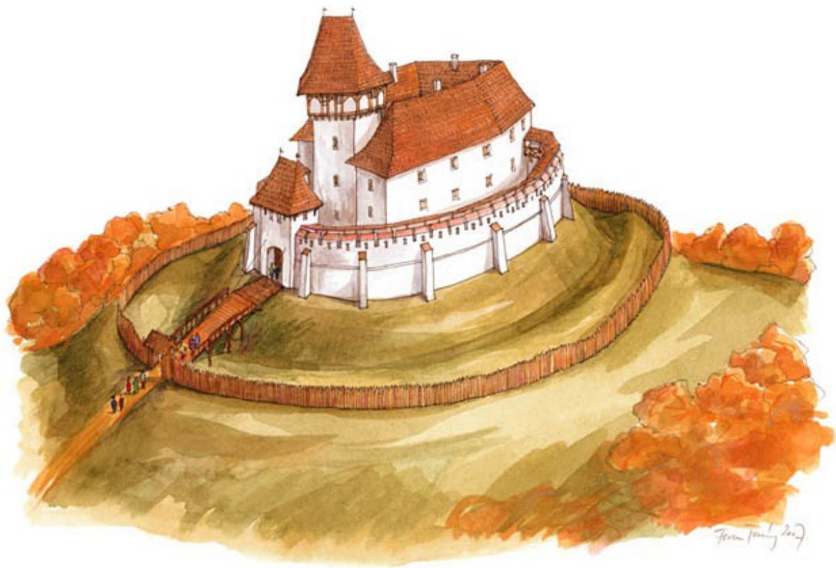
Kereki-Fejérvő várának rekonstrukciós rajza