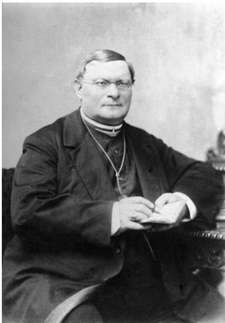
Rómer Flóris, a magyarországi régészet úttörője