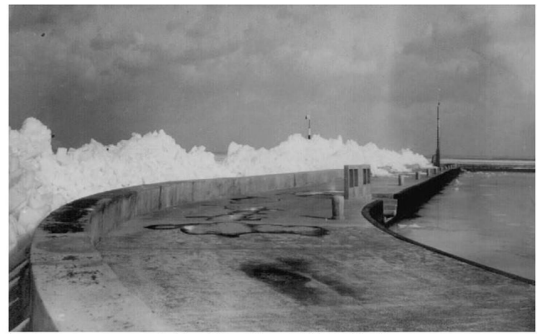
3. kép: Jégzajlás a siófoki mólónál