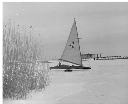
6. kép: Jégvitorlás Balatonfüred környékén