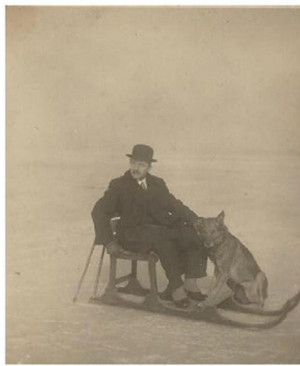
5. kép: Fabutyzó férfi a Balaton jégén

népszerűségnek örvendő eszköz volt a Balaton vidékén, ami „Egy kényelmes szék, alatta két szánkótalp, a kézben két szeges bot, s kész a fakutya, amivel az ügyesebbek szép sebességet érnek el” -mint ahogy a Balatoni Kurírban leírtak alapján szerepel. Sajnos ezt a szerkezetet manapság már csak ritkán láthatjuk, de akárki, aki érez magában rá kreativitást, megpróbálhatja feléleszteni ezt a régi szórakozási formát. Az 1900-as évek környékén kezdett el a jégvitorlázás (6. kép), mint sportág betörni a magyar köztudatba. Gróf Esterházy Mihály és Andrássy Géza voltak az első úttörők, 1934-ben pedig elkezdték gyártani az első szánokat. A jégvitorlázás máig nagy népszerűségnek örvend, és rendszeresen szerveznek bajnokságokat.