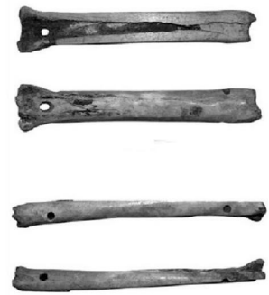
4. kép: Csontkorszak Zamárdi 89. lelőhelyről